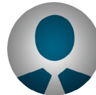
Jorge Gustavo Benalcázar Subía Postulante a Vocal del Consejo de la Judicatura